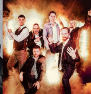
FR 23.06. HEALER