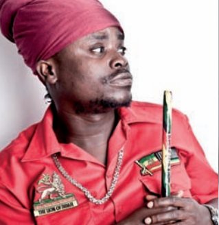
FR 02.06. AFRIKAFESTIVAL 2017 BLACK PROPHE