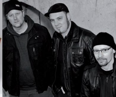
SA 10.06. Metro On Tour SUNTRIGGER