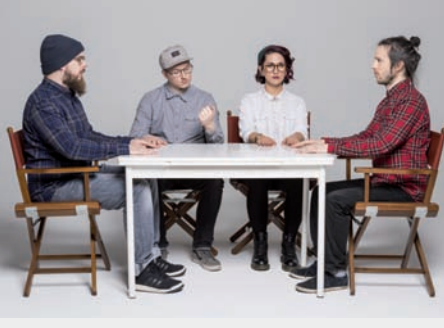
FR 09.06. FRAU KARO